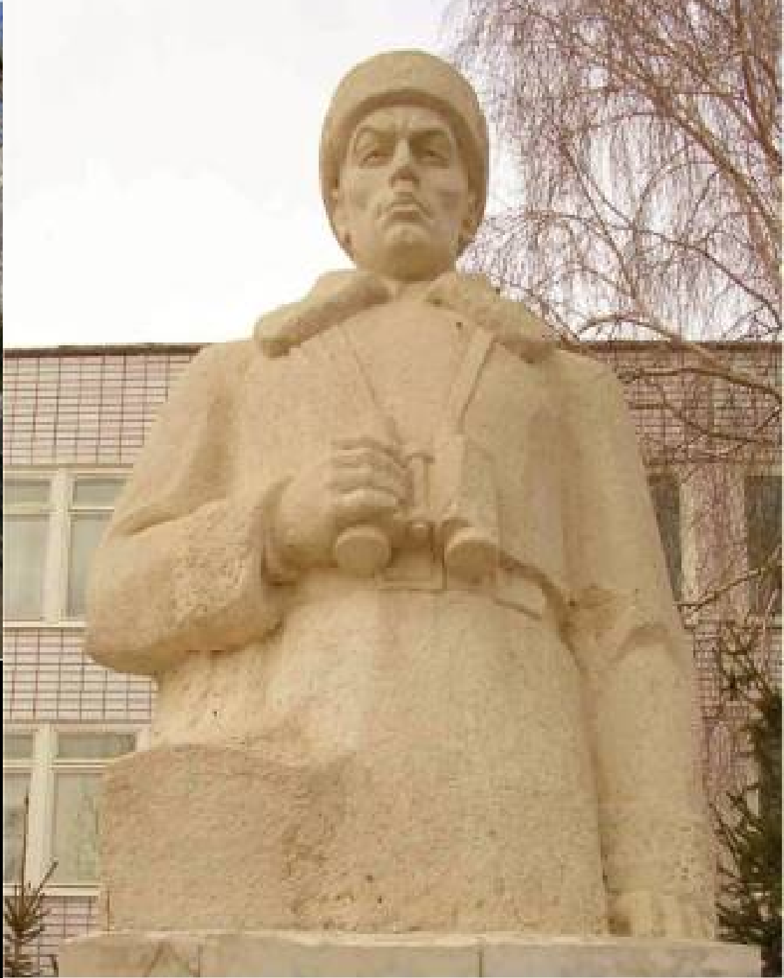
Памятник И.В. Панфилов в г. Петровске около МОУ СОШ №3 имени И.В. Панфилова