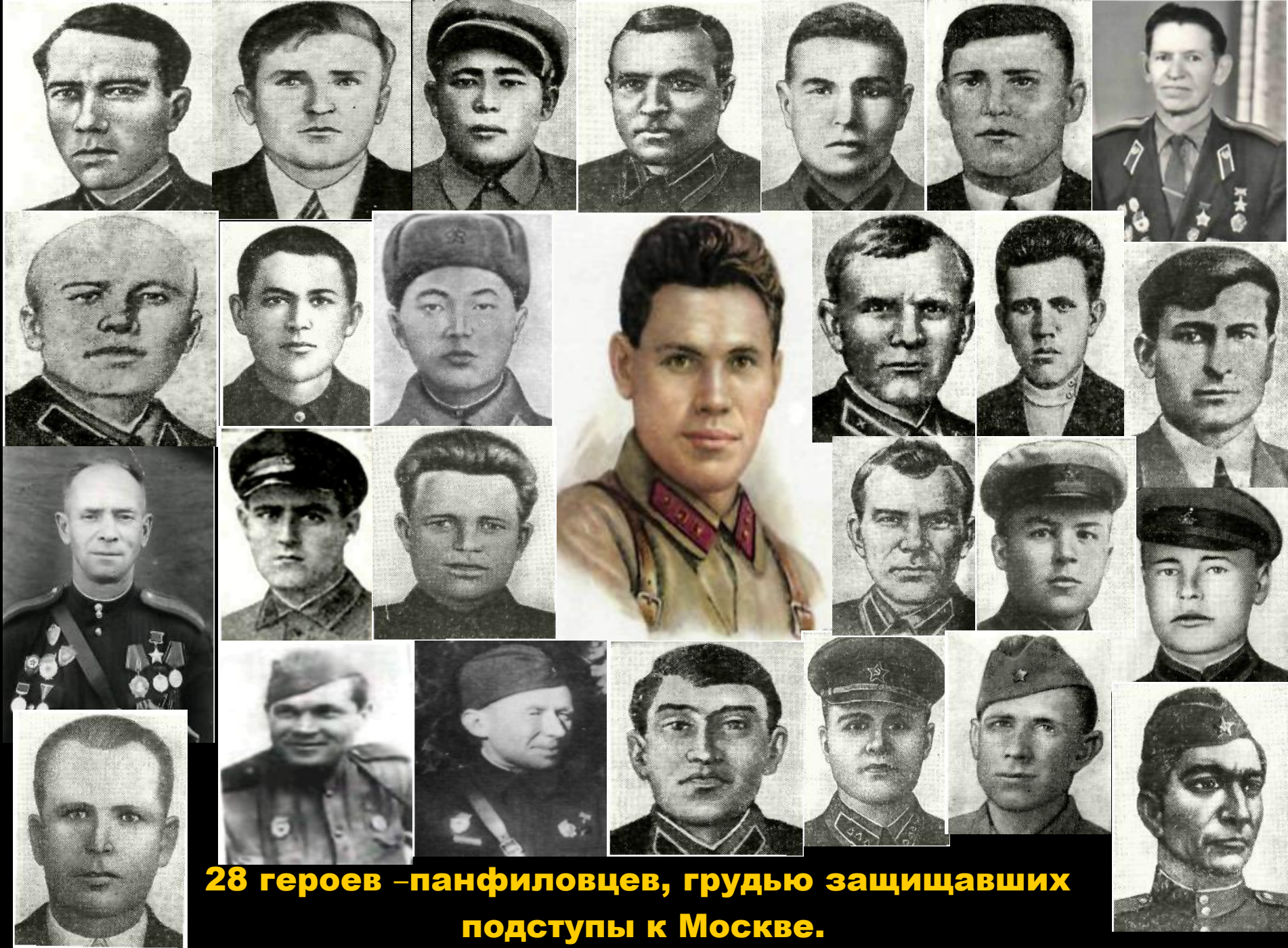
28 героев –панфиловцев, грудью защищавших подступы к Москве.